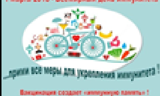
1 марта 2018 - Всемирный день иммунитета

Иммунитет – это способность иммунной системы избавлять организм от генетически чужеродных объектов. Иммунитет заложен в человеке с рождения.